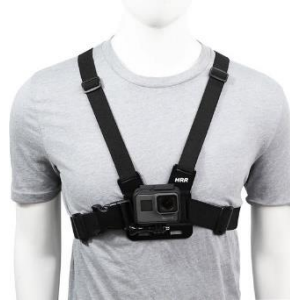
Afbeelding 2: camera

De camera legt geen gezichten of omgeving vast, en alleen uw activiteiten worden gebruikt voor analyse waarin wij de gegevens van de beweegmeter en de camera naast elkaar leggen. Als u een moment van privacy wilt, bijvoorbeeld tijdens een toiletbezoek of als u zich omkleedt, kunt u de camera makkelijk verwijderen en daarna weer bevestigen. Het is wel belangrijk dat u de camera zo min mogelijk af doet, aangezien er op dat moment geen gegevens wordt verzameld.